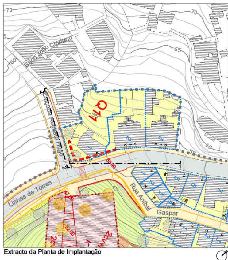
Extracto da Planta de Implantação