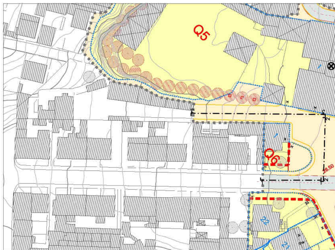
Extracto da Planta de Implantação